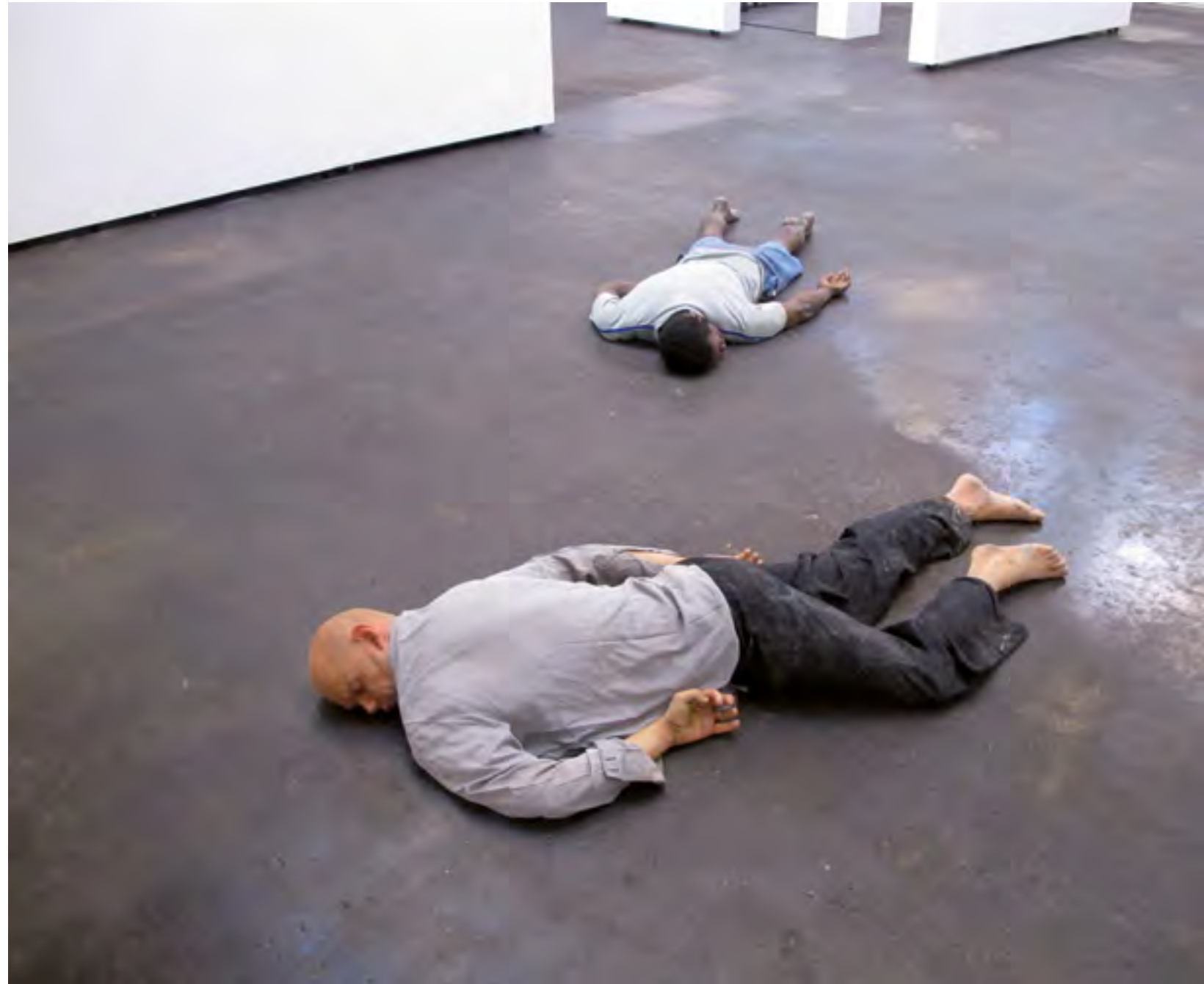
ROY VILLEVOYE THE CLEARING, 2011 SILICONE RUBBER EPOXY TEXTILE HAIR 185 X 100 X 25 CM EACH 2011.

"For Papuans, life and death form a continuity. The spirits of the ancestors live on and at night they use their skulls as a pillow. For me death is the end. There is no emergency exit. But knowing that life passes on to the next generation moves me deeply. I feel connected to the chain of thousand individuals before me."