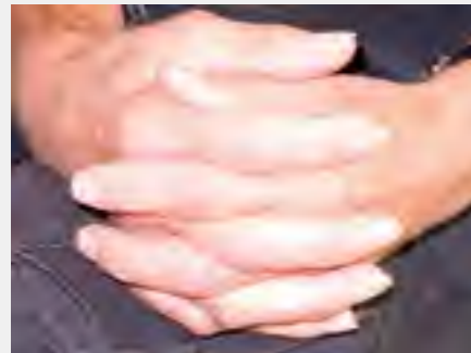
JAAP DE RUIG