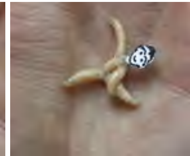
JAAP DE RUIG MAN, 1999 VIDEO DVD COURTESY MARIA CHAILLOUX AMSTERDAM